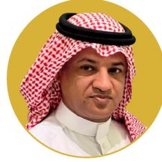
رئيس المجلس عبد الله حسن الأمير